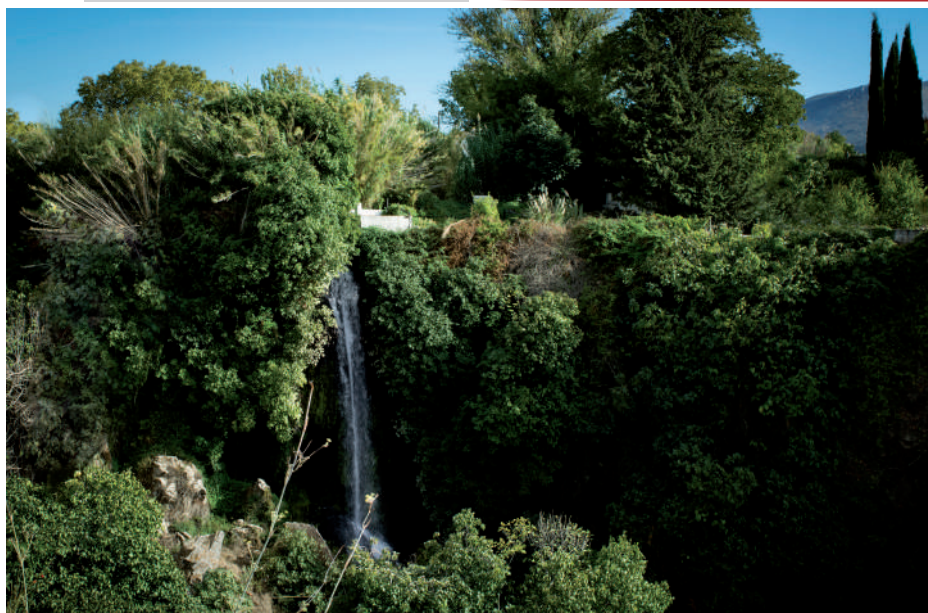
Los Infiernos, Monumento Natural

EDITA / Published by Área de Turismo. Excmo. Ayuntamiento de Loja