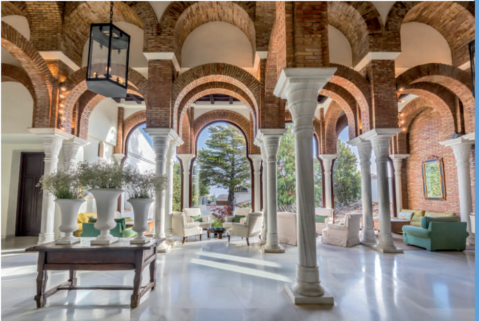
La Bobadilla, a Royal Hideaway Hotel 5* GL