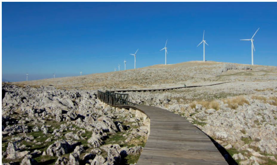
Sierra de Loja

16 COLLADO DEL LEÓN VUT/GR/12419 (3 plazas / 1 habitación) (por habitaciones) Paraje Collado del León, s/n, parcela 727, polígono 6 18300 Loja (Granada)