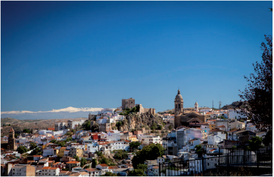
Panorámica de Loja