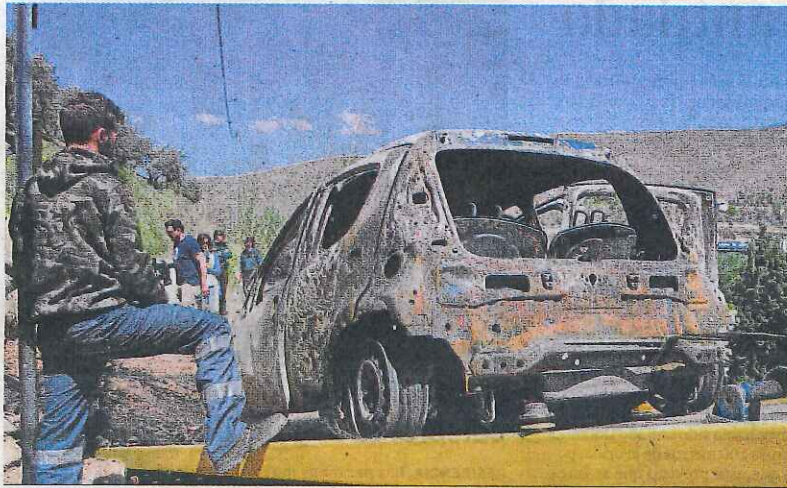
Estado en que quedó el vehículo tras el incendio.

Fuentes de la Policía Local indicaron ayer que los agentes del servicio de extinción de incendios y salvamento sofocaron el